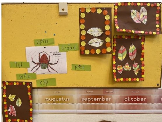
Blaadjes en spinnen in groep ½.

In de bovenbouw wordt ongeveer 9 weken gewerkt aan het thema 'Maori's'. Daarbij wordt de topografische kennis van Oceanië meegenomen, kennis van verschillende volkeren, de geschiedenis (ontdekkingsreizen) en natuur van die omgeving.