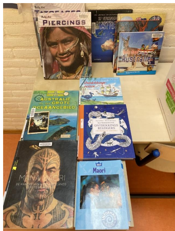
Een greep uit de boeken over de Maori en Oceanië in groep 6/7/8.