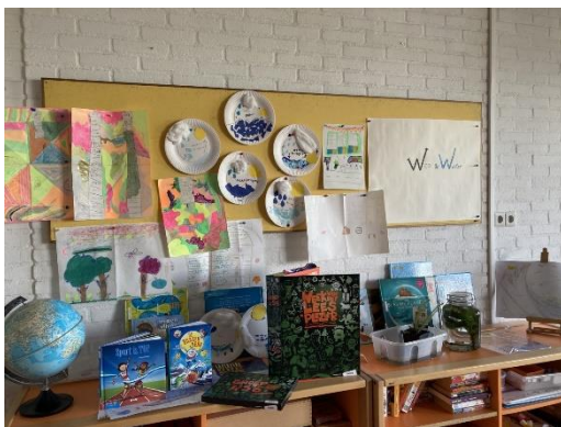
Themamuur groep 456 'Weer en Water'