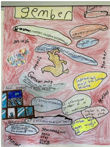
Opdracht taalkast groep 456