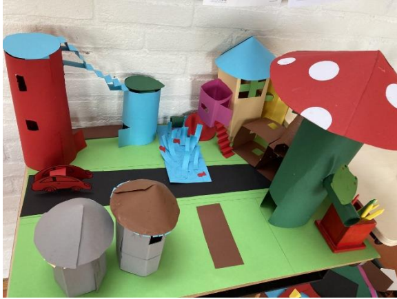
3D opdracht bouwen en samenwerken, groep 7/8