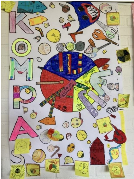
Moreel kompas, groep 456