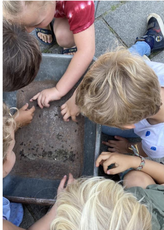
Pissebedden zoeken en verzorgen

MR Om over na de te denken: er komt een plek in de medezeggenschapsraad (MR, op schoolniveau) Hierover komt nog een uitgebreidere beschrijving in het Wierdenieuws. Maar als je het als ouder leuk vindt om te duiken in de beleidsmatige kant van de school, dan zou dit iets voor je kunnen zijn. De functie als voorzitter van de overblijfcommissie is in principe verbonden aan de functie van MR-lid.