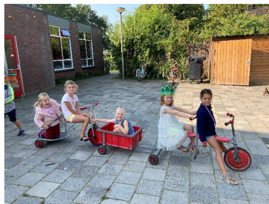
Op Prinsjesdag geen Gouden Koets? Dan doen wij wel een Prinsessenoptocht.

In de onderbouw ronden we het thema 'zomer' zo langzamerhand af en starten we komende week met het thema 'herfst'. Op www.davincivoorthuis.nl wordt het thema en het doel als volgt beschreven. 'We hebben het over de herfst en verwonderen ons over de natuur en de prachtige kleuren. We bestuderen de bomen, de bladeren, hun vruchten en zaden en de dieren die ze verzamelen voor de winter zoals de eekhoorn. We gaan de begrippen groot en klein bestuderen vanuit kleine dieren zoals de spin, de mier en de slak. Dat is meteen een leuk gespreksonderwerp: Vindt u uw kind groot? Of nog klein? Wanneer voelt u zich groot en wanneer klein?' Via de Parro app houden we ouders op de hoogte van de vorderingen.