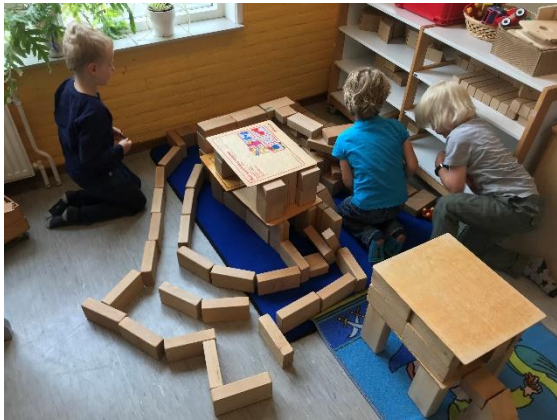
Lekker in de bouwhoek