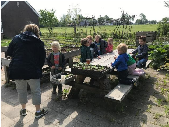
Andijvie in de moestuin