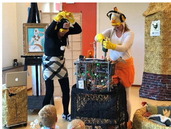
Voorstelling Kip en Koe over 'vriendschap', het thema van de kinderboekenweek 2018.

Dit jaar valt Sint Maarten op een zondag. Het is niet gebruikelijk om op zondag Sint Maarten te lopen. De beslissing voor een alternatieve dag neemt de gemeente niet en daarom is er vanuit school overleg geweest met de VVV Adorp en de school in Sauwerd. Allen zijn het erover eens, dat zaterdag 10 november de beste optie is. Dit zal ook aangekondigd worden op de prikboards in het dorp. Op die manier is iedereen die er rekening mee wil houden tijdig op de hoogte.