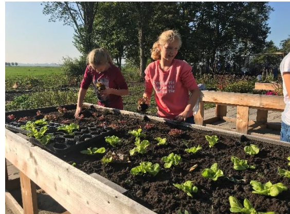
De slaplantjes worden goed verzorgd.