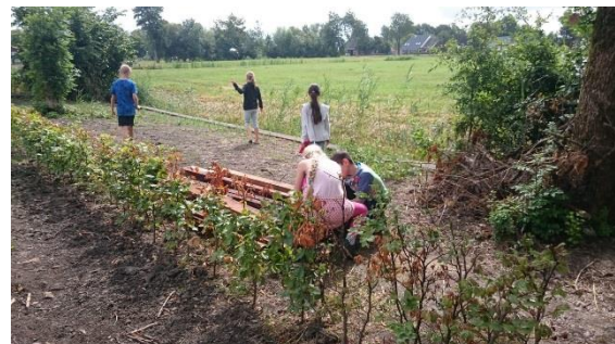
Groep 8 geeft les: zoek de kaartjes met sommen, reken uit, welke groep is als eerste klaar met de minste fouten?