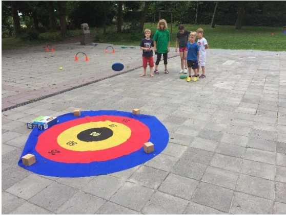
Sportdag groep 1 t/m 4: groep 8 begeleidt de groepjes.