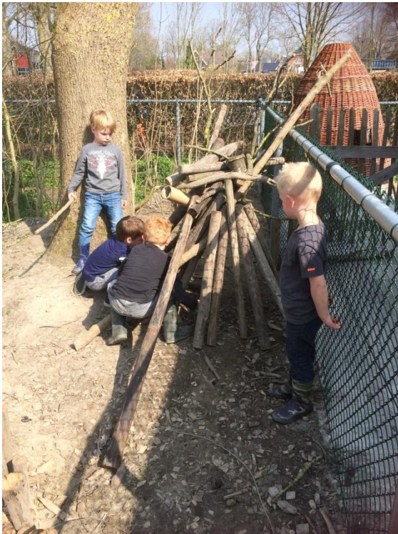
'Wat de grote kinderen kunnen, kunnen wij ook': hutten bouwen op het kleine plein.

ICT en was een inspiratie dag voor alle onderwijskundige en organisatorische vernieuwingen in ons onderwijs. Er waren workshops te volgen en alle vernieuwingen op het gebied bijvoorbeeld robotica en VR / AR konden de aanwezigen ervaren. Er zijn verschillende workshops gevolgd en er is vooral praktische kennis opgedaan over educatieve programma's. Daarnaast hebben we een stand ingericht met informatie over onze manier van werken met Exova M4th. Het was een mooie ervaring om te vertellen, wat we allemaal al doen op dit gebied. Wanneer het aan een ander overgedragen moet worden, levert dit extra inzicht op in wat je allemaal al doet. Een opsteker voor onze gepersonaliseerde manier van werken met rekenen.