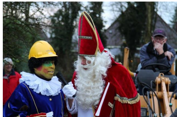
Sint roept hoofd- kluspiet ter verantwoording.

www.jouwzoekmachine.nl is een kindvriendelijke zoekmachine van 0 tot 18 jaar. Kinderen vullen hun leeftijd in en de informatie over het ingevoerde onderwerp wordt op hun leeftijd aangepast.