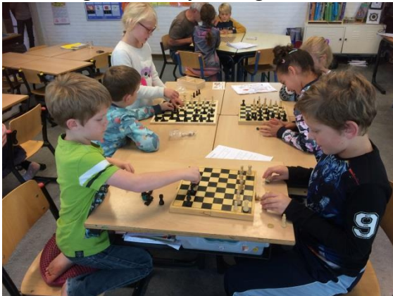
Schaakles groep 4 en 5.

Op maandag 6 november zijn de schaaklessen na schooltijd gestart. Een groepje van acht kinderen heeft van 15.15 tot 16.15 uur schaakles in school. Mochten er nog kinderen willen aansluiten, dan kan dit. Graag melden bij ondergetekende.