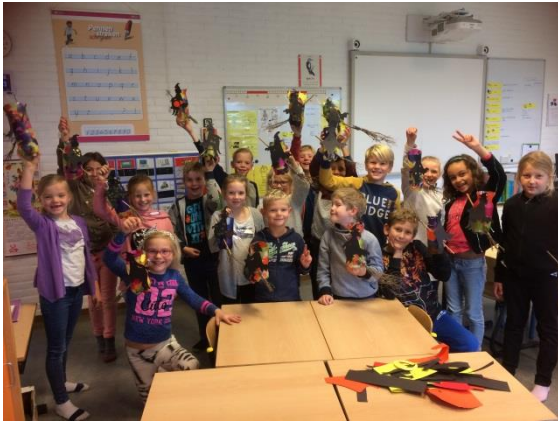
Lampionnen groep 4 en 5.

De oudergesprekken voor groep 3 t/m 8 vinden plaats op maandag 20 en woensdag 22 november. Dinsdag is er een scholenmarkt voor de kinderen van groep 8 (en 7) en worden er geen gesprekken gepland.