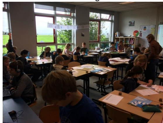
Inloop rekenlessen M4th.

doen, dus een andere groep enthousiastelingen heeft dit opgepakt. In week 47 (20 – 24 november) kunt u op school speelgoed (geen knuffels) inleveren in het extra lokaal. Vrijdagochtend wordt het speelgoed opgehaald. Het speelgoed wordt gegeven aan kinderen, die in een gezin opgroeien, dat niet in staat is cadeaus voor de feestdagen te betalen.