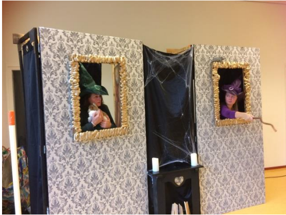
Voorstelling 'Helpen is niet griezelig' van MoDo in het thema van de kinderboekenweek