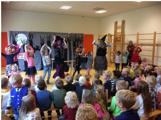
Iedereen mag meedansen tijdens de voorstelling 'Een beetje vreemd' door JOAN.