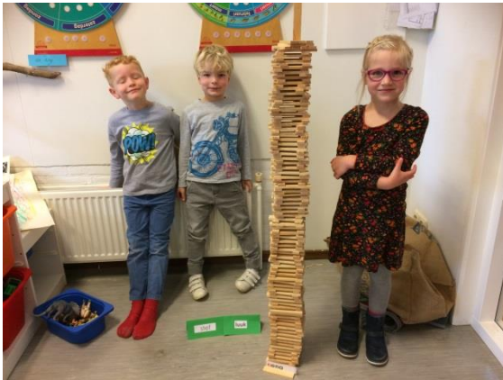
Kapla, groep 2.

beurt is, hangt op het whiteboard in de klas maar iedereen krijgt ook een kopie van de planning mee naar huis.