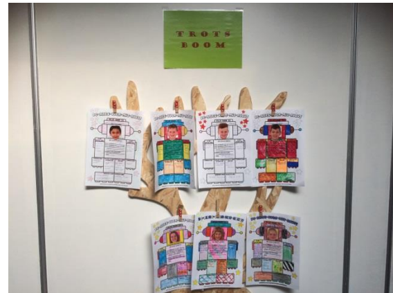
Trotsboom nieuwe stijl.

Hartelijk dank aan de Culturele Commissie Adorp (CCA), die ons en De Meander financieel ondersteunt bij het aanbod van deze voorstellingen.