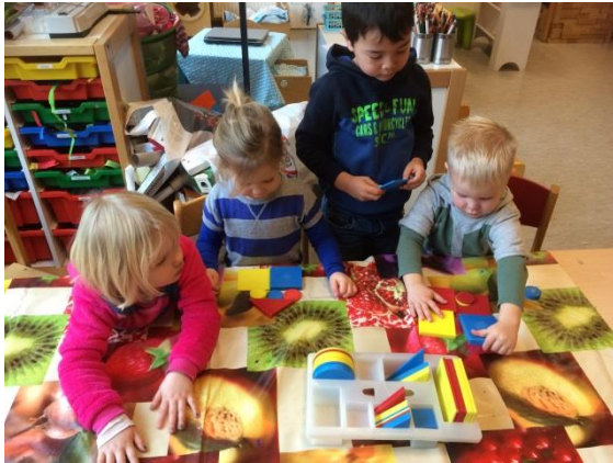
Kleuters als tutor van de peuters.

https://www.oudersonderwijs.nl/nieuws/ouders-gezocht-voor-staat-van-de-ouder/