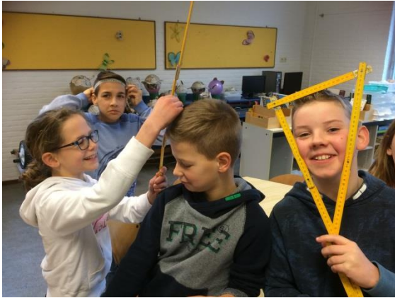
Metten is weten, rekenles groep 6.