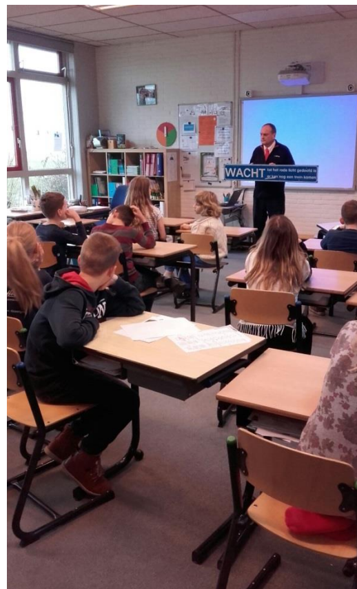
Gastles Arriva over gevaren bij spoorwegovergangen, groep 6/7/8.