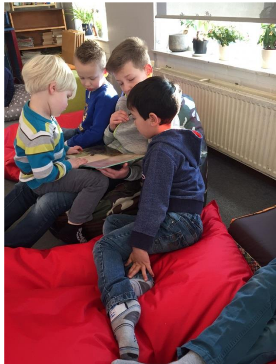
Groot leest klein voor uit 'Kwallenpap en slakkenvla' tijdens de leesmarathon

De poëzie weken zijn in volle gang en kinderen werken met veel enthousiasme aan naamdichten, elfjes, gedichtenbundels en soms ook overtypen wat ze mooi vinden. Ook worden de woorden van de gedichten mooi bewerkt en zijn de kinderen met de vormgeving bezig. De peuters en de kleuters nemen hun ingestudeerde gedichtjes op voor de presentatie. Er is veel animo voor de presentatie en deze vindt plaats op donderdag 22 februari van 17.00 uur tot 18.00 uur , zoals ook te zien was op de lijsten in de klas. We hopen dat de kinderen er naar uitkijken om te laten zien waar we met elkaar aan gewerkt hebben. Opa's, oma's, burens, dorpsgenoten etc ook van harte welkom!