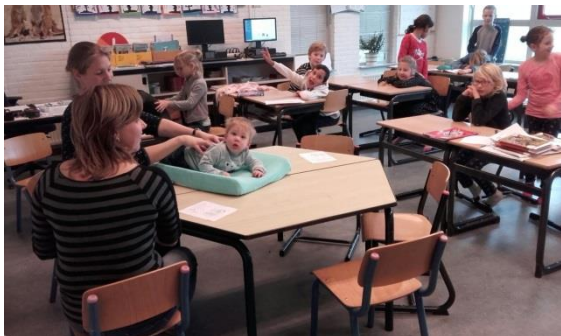
Workshop pizza-massage en een presentatie van babymassage in de middenbouw.

Activiteiten die we sowieso zullen plannen, zijn: samen lezen (met zitzakken?), buitenspelen, gymnastiek, spelletjes. U ontvangt na 7 februari (de uiterlijke opgavedatum) en ruim voor 14 februari het programma.