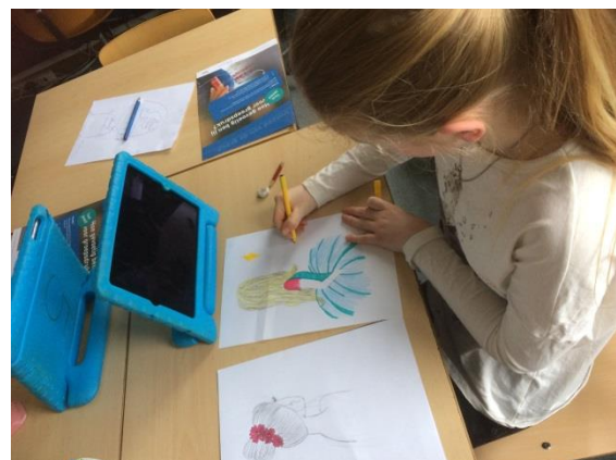
Tekenen in groep 8

Op donderdag 8 maart is er in de kinderopvang een ouderavond over gezonde voeding voor kinderen van 0 tot 12 jaar. Mochten er ouders zijn die geen kinderopvang afnemen, maar wel interesse hebben in dit onderwerp, van harte welkom. Graag van tevoren opgeven bij Saskia van Heuvelen 06 144 24 635.