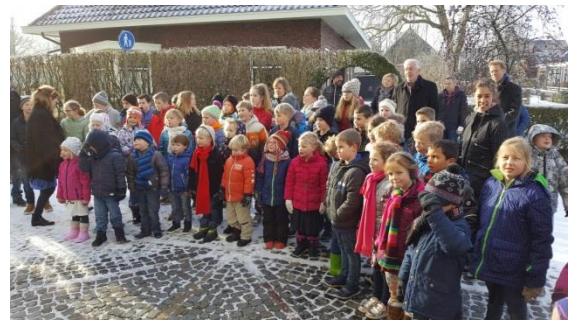
Opening project 'Sleutelbewaarders', met elkaar zingen: 'In Adorp staat een kerk'.

toelichting voor de ouders van groep 6, 7 en 8.